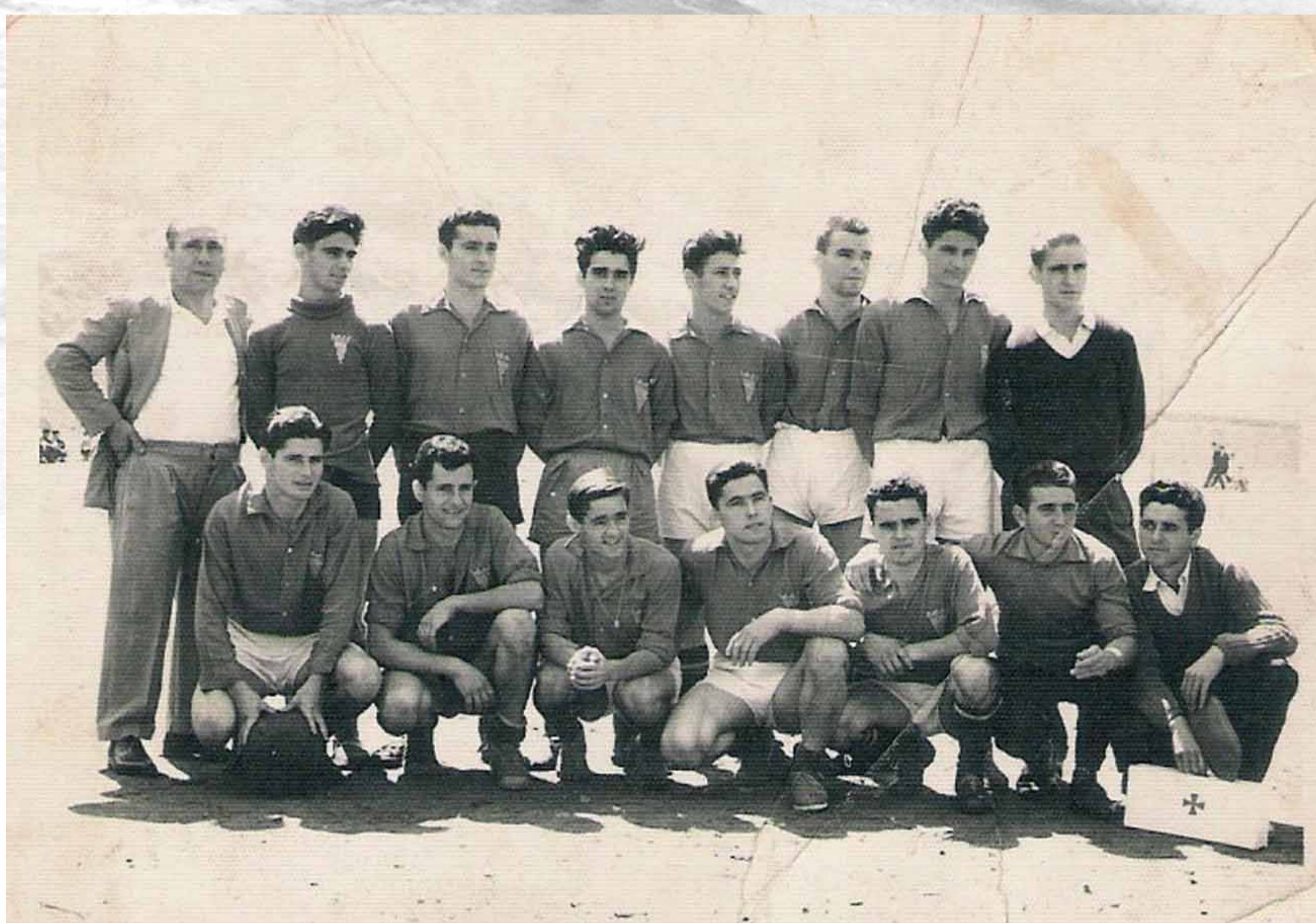
S.D. Santa Marina. 03-08-1958