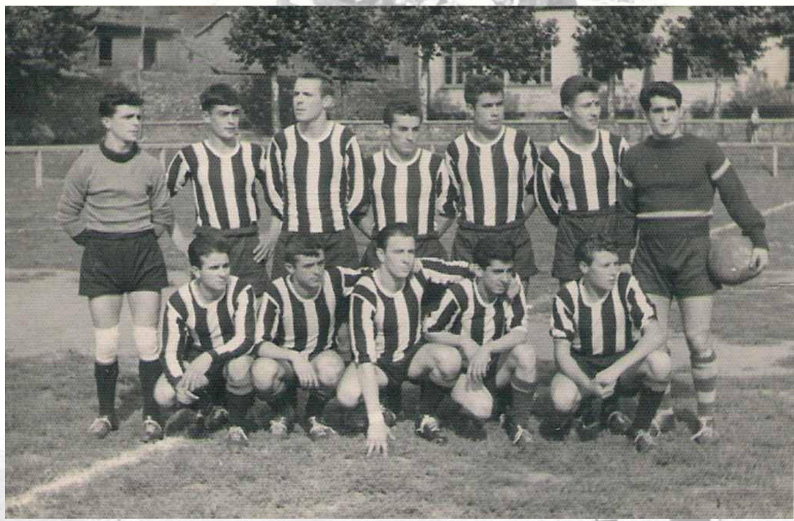
CAMPO LAS MORERAS FOTO DE EQUIPO Tal vez la formación más potente de este equipo.